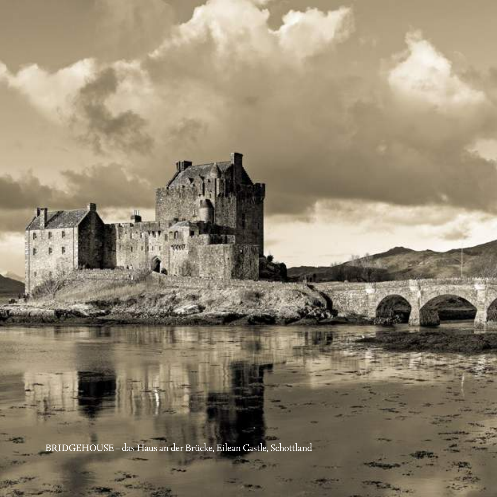
BRIDGEHOUSE – das Haus an der Brücke, Eilean Castle, Schottland